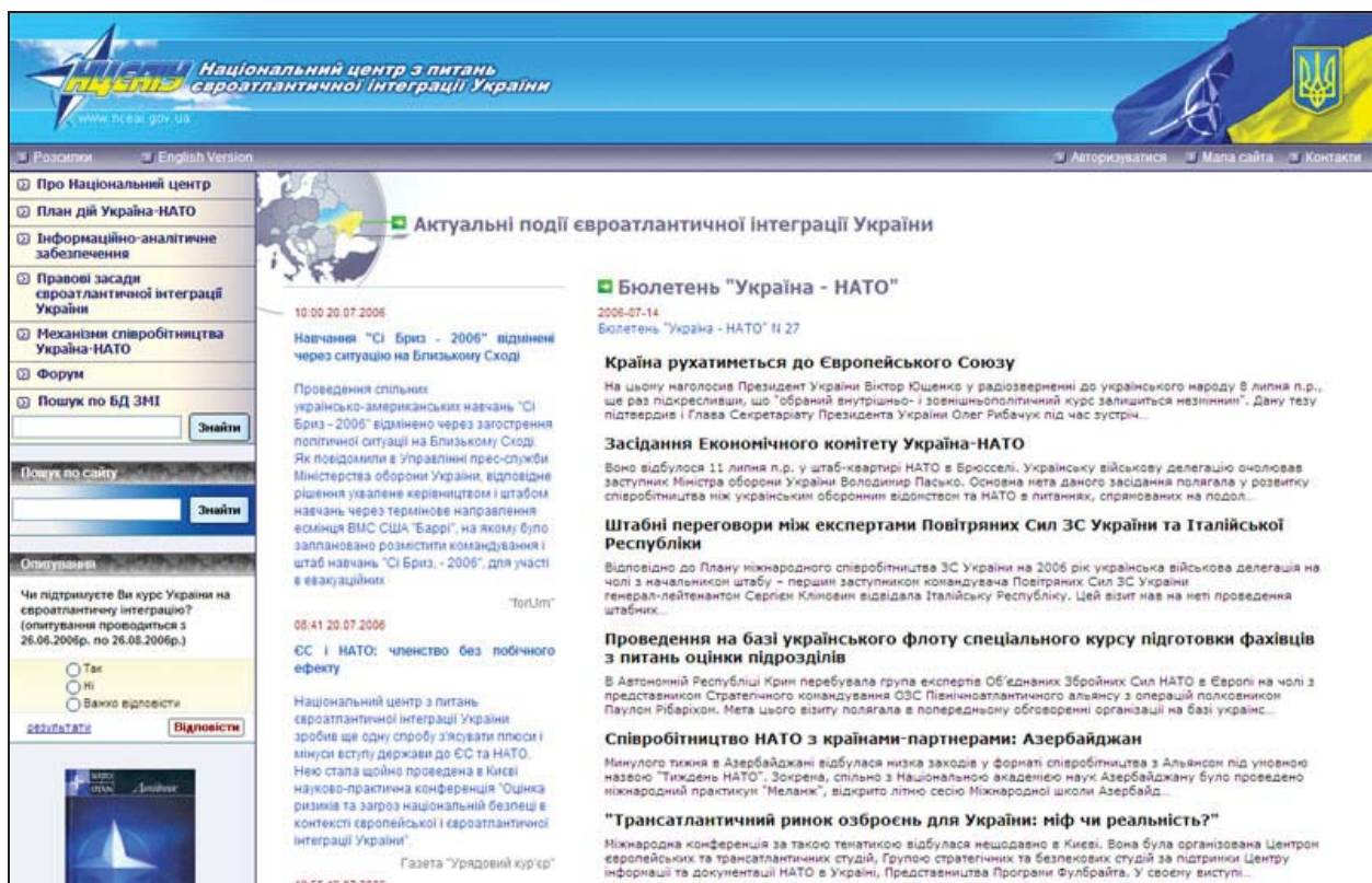
Рис. 4. Головна сторінка веб-сайту апарату Національного центру з питань євроатлантичної інтеграції України

З метою підтвердження ефективності запропонованих і розроблених механізмів та інструментарію використання інформації, яка циркулює у мережі Інтернет, для оцінки ситуації та прийняття відповідних рішень, а також - підвищення рівня обізнаності населення країни щодо співробітництва України з НАТО розроблено нову версію веб-сайту апарату Національного центру з питань євроатлантичної інтеграції України, який розміщено за адресою www.nceai.gov.ua (Рис. 4).