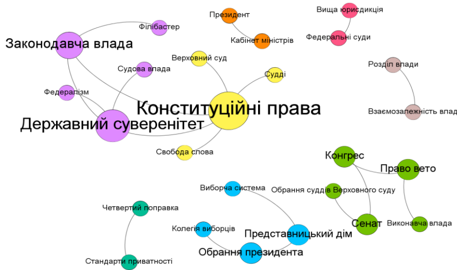
Рис. 1. Ненаправлена мережа 20 головних понять Конституції США за оцінкою програми ChatGPT

Система ChatGPT може видавати різні варіанти відповідей на текст у різні моменти обробки, причому всі вони можуть бути правильними з точки зору людської логіки. Кожен з таких варіантів можна сприймати як відповідь від окремого штучного експерта [6 – 7].