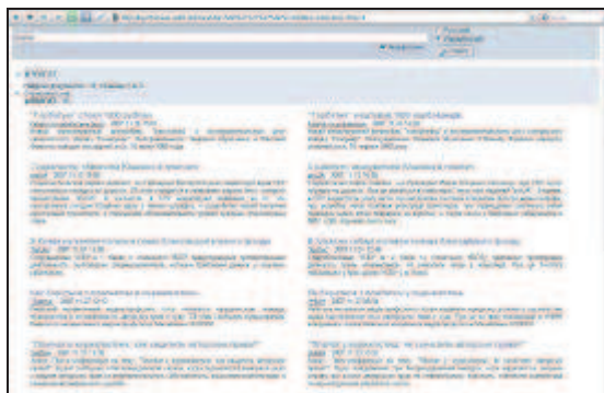
Рис. 3. Інтерфейс системи пошуку у двомовному корпусі

З отриманого корпусу документів було вибрано 1000 випадкових документів, які піддалися вивченню експертами. Аналіз показав, що у середньому 98% змісту кожного документа мають різні доповнення та зміни: наприклад, посилання на інше видавництво, або ж інший заголовок. Також аналіз показав, що з 1000 обраних документів знайшовся один документ, що не зовсім відповідав документу на іншій мові. Відмінність складалася лише у тому, що в документі перекладу були більш докладно описані подробиці первинної статті, а довжина первинної статті була дуже малою - близько 40 слів.