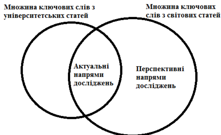
Рис. 1. Діаграма перетину мереж термінів